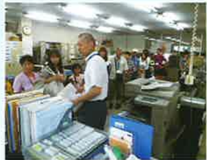
営業部・総務部のある2F 事務所です。たくさんの方に資料に皆さんびっくりに。