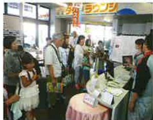
お客様とスタッフを繋ぐ窓口、ショールーム。多くのお仕事をこなすショールームレディ達に脱帽。