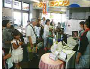
お客様とスタッフを繋ぐ窓口、ショールーム。多くのお仕事をこなすショールームレディ達に脱帽。