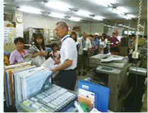
営業部・総務部のある2F 事務所です。たくさんの方に皆さんびっくりに。